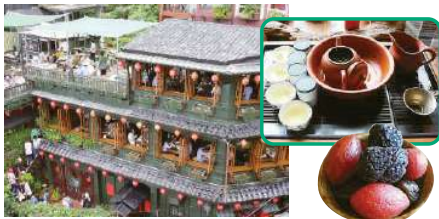
「千と千尋」の旅館のモデルになった九份。台北から小一時間ぜひ一度……。

中国の北京語が標準語とされ、学校教育は北京語で行われていますが、現地の 8 割以上の人々は台湾語を日常会話で用いています。台湾は親日的です。ホテルや土産物店では日本語が通じるところも多いです。