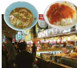
庶民の台所、屋台で舌鼓。

基本的に日本の冬よりは暖かいです。実際の気温よりも肌寒く感じます。セーターなどが必要になることもあります。