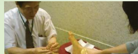
▲受講者の体の状態、希望にあわせたポイント指導が行われます。