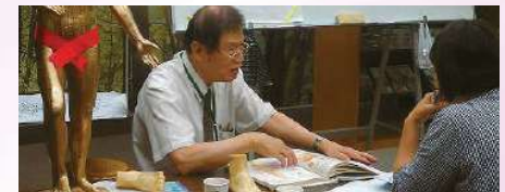
▲日本語のできる先生が、納得がいくまできちんと教えてくれます。